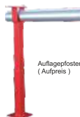
Auflagepfosten höhenverstellbar (Aufpreis)