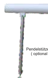
Pendelstütze höhenverstellbar (optional ohne Aufpreis)